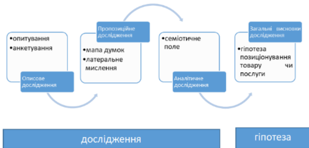
Рис. 2. Методи дизайнерського дослідження на етапах дослідження та гіпотези в алгоритмі проектування бренду

Метафора бренду формулюється на основі загальних висновків дизайнерського дослідження (Рис. 1-2). Результати опитування та анкетування виявляють основні цінності бренду, його переваги та особливості. Мапа думок допомагає визначити центральну цінність чи перевагу бренду, латеральне мислення допомагає побачити це під іншим нетрадиційним кутом зору. Стягнуте семіотичне поле ресурсів налаштовує свідомість дизайнера на виявлення в цій площині графічного дизайн-образу. Етап формулювання гіпотези позиціонування товару чи послуг на ринку через основні заявки та обіцянки бренду конкретизують метафоричне формулювання дизайн-образу.