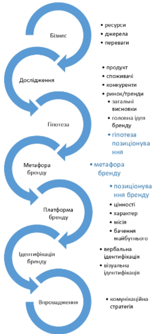
Рис. 1. Алгоритм проектування бренду

Вироблення ідеї досліджуваного питання та вивчення методів дизайнерського дослідження у графічному дизайні дозволило нам визначити методи дослідження продукту, для якого проектується бренд, а також запропонувати операціоналізовані конкретні речі [2-4].