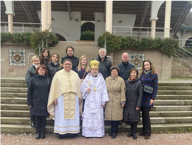
Другий день конференції, с. Зарванця