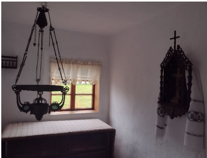
Музей-садиба Патріарха Йосифа Сліпого у с. Заздрість