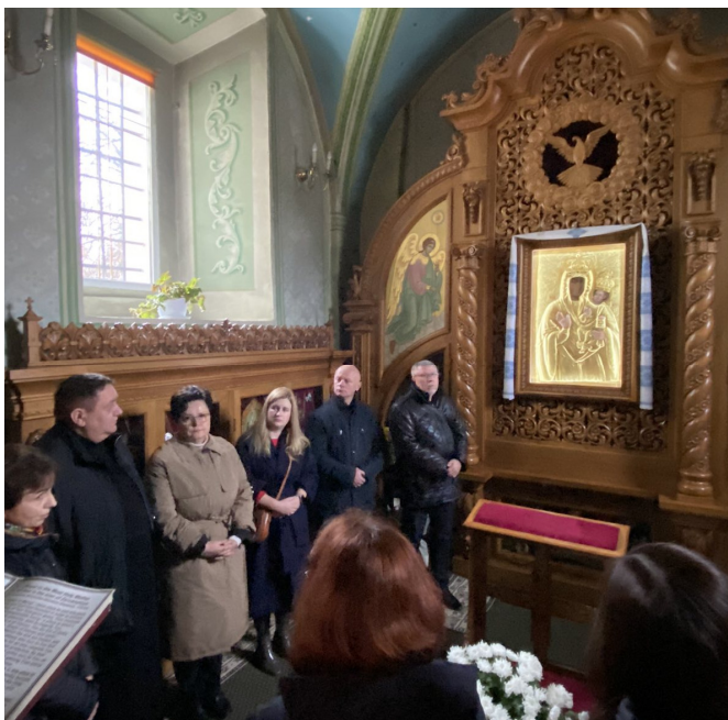
Ікона Божої Матері Зарваницької, Церква Пресвятої Трійці у с. Зарваниця