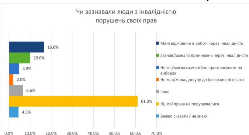
Рис. 3 Результати опитування щодо порушення прав людей з інвалідністю

підготовки відповідних спеціалістів; виконання цільових програм соціального і правового захисту ветеранів війни; надання пільг, переваг та соціальних гарантій у процесі трудової діяльності відповідно до професійної підготовки і з урахуванням стану здоров'я. За даними статистики всеукраїнського опитування «Думки і погляди населення України» (Омнібус) станом на вересень 2020 року можемо побачити такі результати на запитання “Чи зазнавали люди з інвалідністю порушення своїх правил ?” та “Чи вдалося людям з інвалідністю захистити свої права?” :