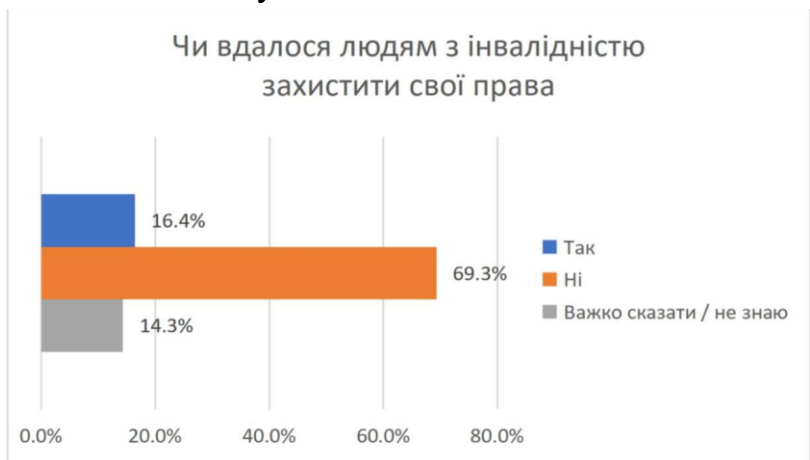
Рис. 3 Результати опитування щодо можливості захисту своїх прав людей з інвалідністю

Ця статистика ілюструє, що попри значний відсоток людей, які не відчували порушення своїх прав, значна частина все ж стикається із дискримінацією або обмеженнями в доступі до базових можливостей.