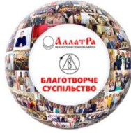
БЛАГОТВОРЧЕ СУСПІЛЬСТВО МІЖНАРОДНИЙ ПРОЕКТ МІР «АЛЛАТРА»